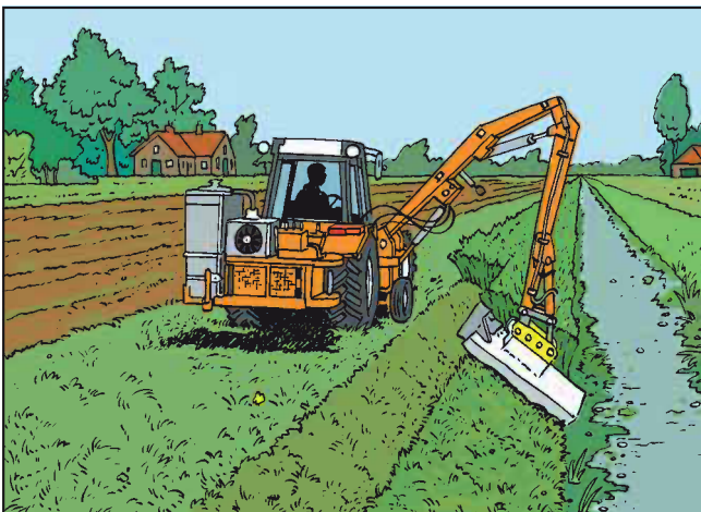
Zo werkt de bermmaaier

Sommige boeren hebben in het drassig akkerland buizen die overtollig water afvoeren naar de sloot. Drainage wordt dat genoemd. Het afvoersysteem kan verstopt raken doordat met het water ook aarde in de buizen terecht komt. De loonwerker heeft apparatuur om ze schoon te maken. Lang niet elke loonwerker heeft zo'n apparaat. Voor elke machine geldt: het hangt ervan af hoe vaak de loonwerker haar kan verhuren.