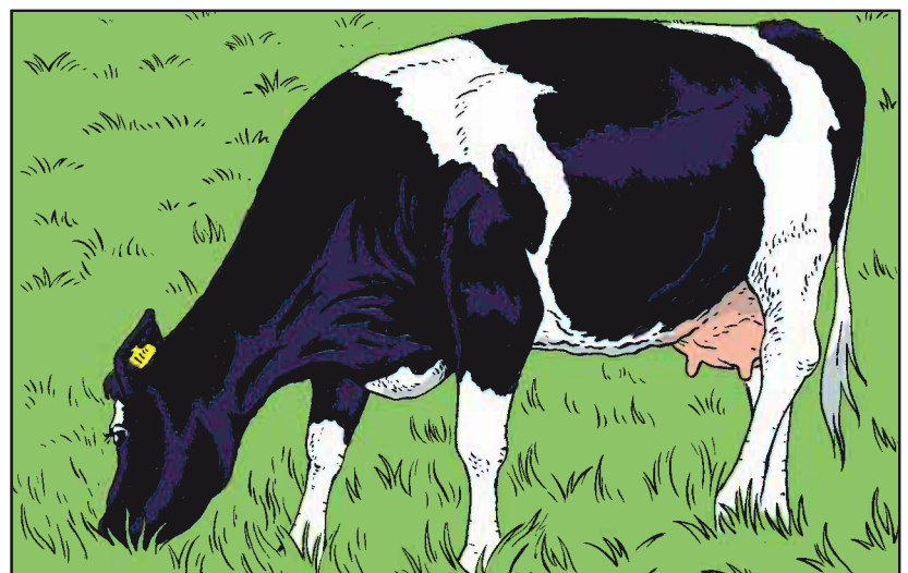
Koeien zijn dol op gras