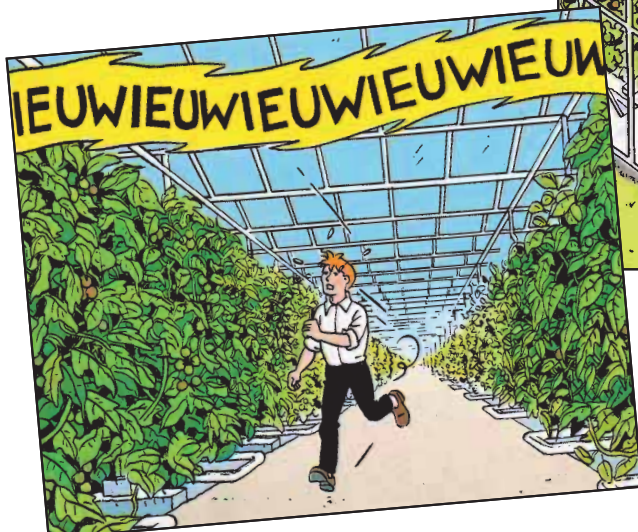
De computer gilt