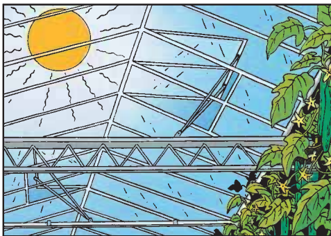
De ramen gaan open

De klimaatcomputer kan ook een beetje praten, nou ja, je kan beter zeggen: vreselijk piepen. Als er bij voorbeeld bij het werk in de kas een draadje van de computer is losgeraakt of als het te warm of te koud is in de kas gilt de computer alles en iedereen bij elkaar. De tuinder weet dan dat er iets fout is en kan het probleem snel oplossen.