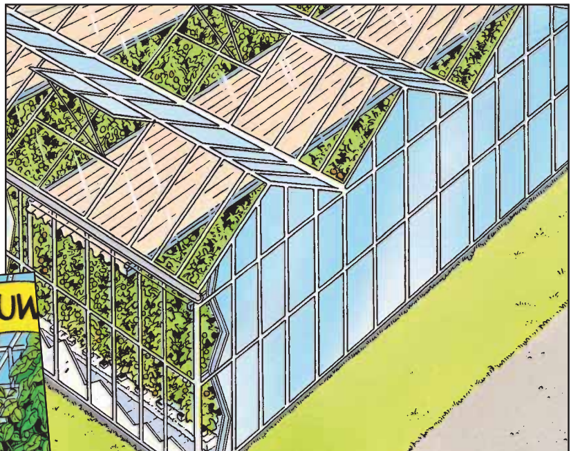
Een scherm kan boven de planten worden geschoven