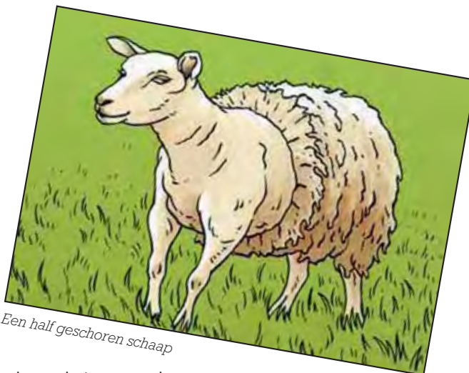
Een half geschoren schaap

Schapen geven ons vlees en wol, heel soms worden ze gemolken. Een schaap kan op nog meer manieren voor ons nuttig zijn. Ken je heideschapen? Ze lopen in een kudde op de heide met een herder erbij. Hun lijf is langer dan dat van een Texelaar en op hun lange staart zit wol. De hele dag knabbe-