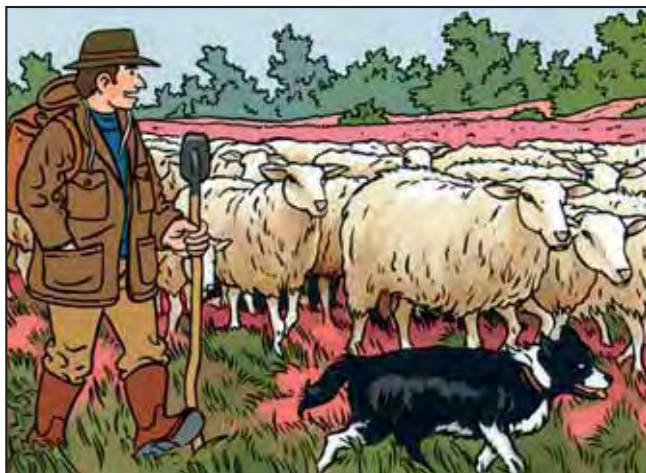
Een schaap-herder met heideschapen

Wist je dat schapen gouden voetjes en bekken hebben? Niet echt natuurlijk. Er wordt mee bedoeld dat de poten en bekken van schapen ons veel waard zijn, net zoals goud. Met hun fijne poten trappen de schapen de grond goed aan. Hun bek bijt het gras kort af. Hierdoor wordt het gras net een dichte mat. Vooral op dijken is dat heel belangrijk. Dat korte, dichte gras maakt de dijk extra stevig. Zo helpen de schapen om het water tegen te houden.